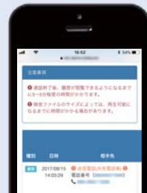
スマホでも確認できるWEB管理画面

アカウントごとの権限付与や、迷惑電話番号の登録など、全ての設定がweb上で一元管理できます。