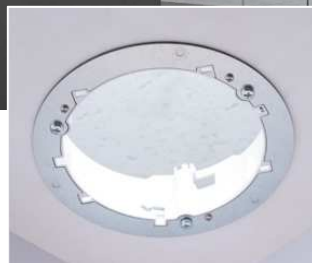
設置用穴はΦ150mm ダウンライトと同径設計