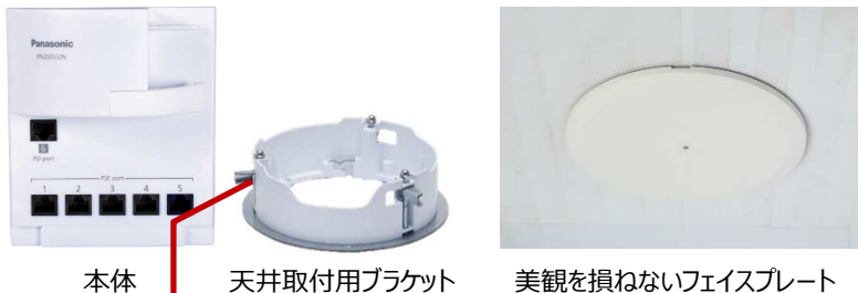
本体 天井取付用ブラケット 美観を損ねないフェイスプレート