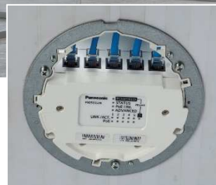
LEDでステータスの 確認可能