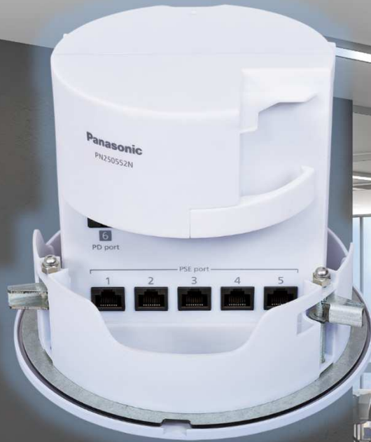
CiLIN-5PoE+PD PN250552N (オープン価格)