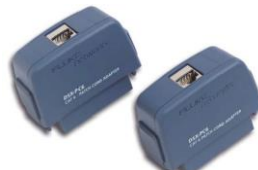
DSX-PC6S (Cat 6 用)