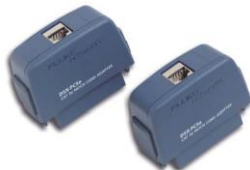
DSX-PC5ES (Cat 5e 用)

JIS X 5153: 2022 規格が2022年12月20日付けで制定されました!