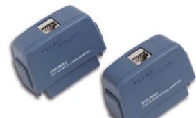
DSX-PC6AS (Cat 6A 用)