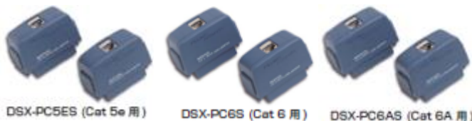
DSX-PC5ES (Cat 5e 用)